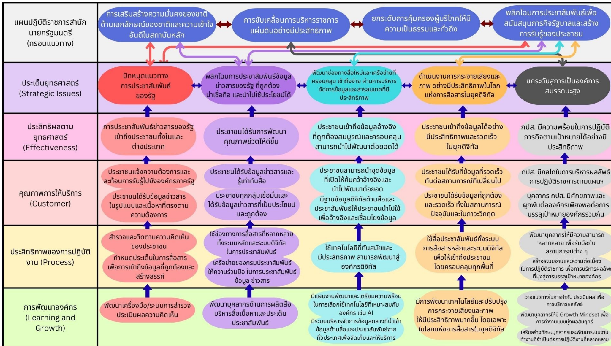
แผนที่ยุทธศาสตร์กรมประชาสัมพันธ์ (PRD Strategy Map) ประจำปีงบประมาณ พ.ศ. 2569